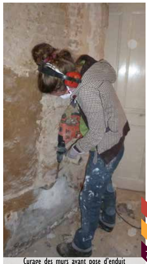
Curage des murs avant pose d'enduit