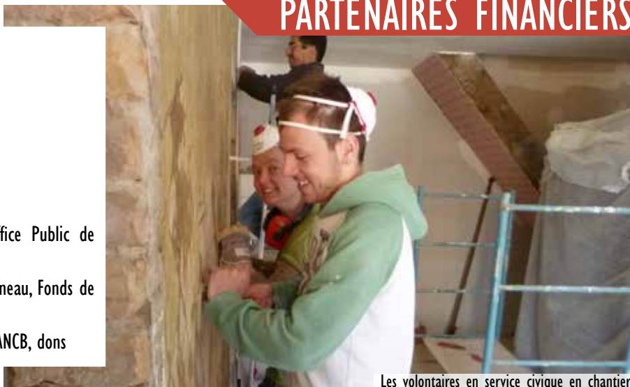
Les volontaires en service civique en chantier

ETAT : CGET, FDVA, FIPD, FONJEP REGION : Auvergne-Rhône-Alpes DEPARTEMENTS : Drôme COMMUNAUTES URBAINES : Métropole de Lyon COMMUNES : Oullins, Valence CAF : Rhône, Drôme, Isère MSA : Drôme/Ardèche/Loire BAILLEURS : Lyon Métropole Habitat, ICF Habitat, Office Public de l'Habitat de Valence FONDATIONS : Fondation Abbé Pierre, Fondation JM Bruneau, Fonds de Dotation Compagnons Bâisseurs AUTRES : Les petits frères des Pauvres, AG2R, ADEME, ANCB, dons