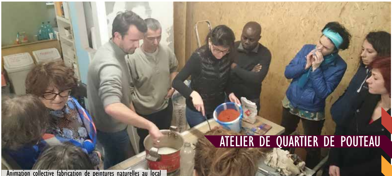
Animation collective fabrication de peintures naturelles au local