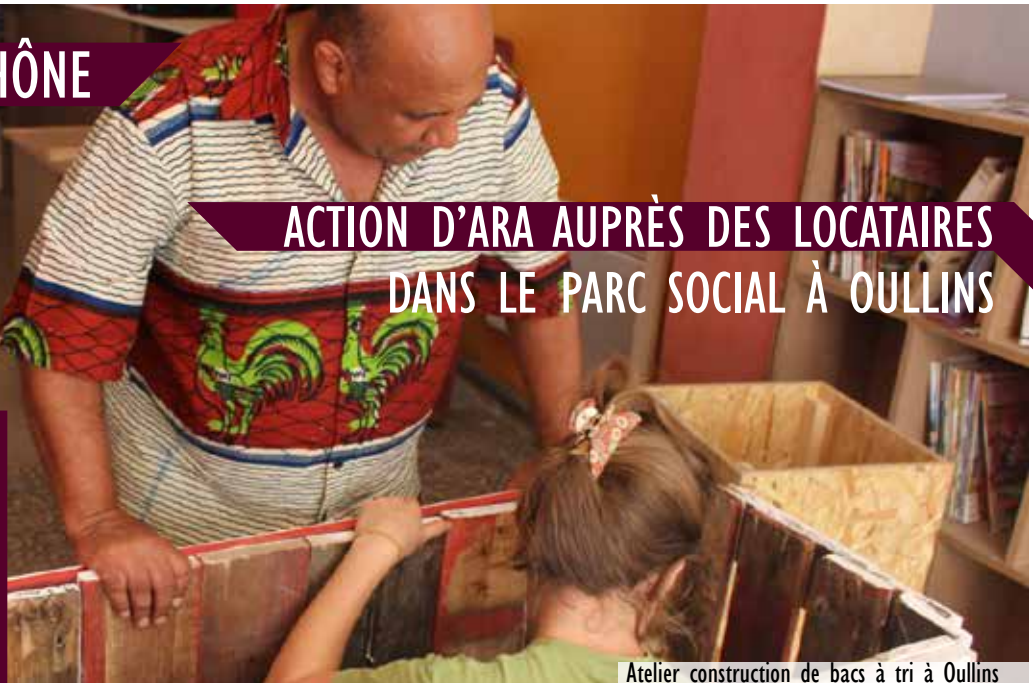
Atelier construction de bacs à tri à Oullins

10 ateliers de bricolage (84 participants) 24 ateliers libres (109 participants)