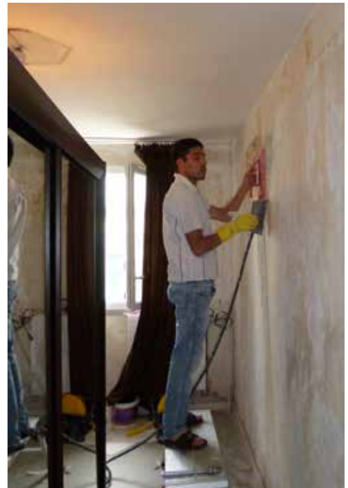
Préparation des murs avant peinture